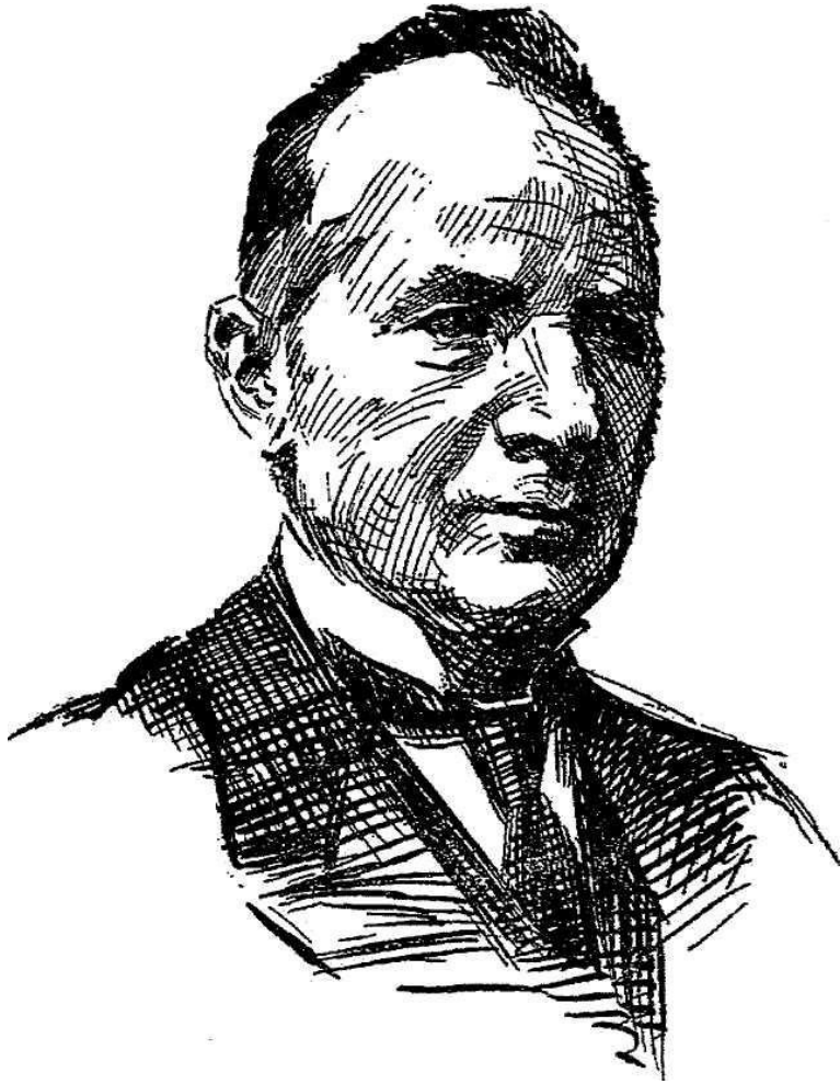
Oskara Noriņa zīmējums